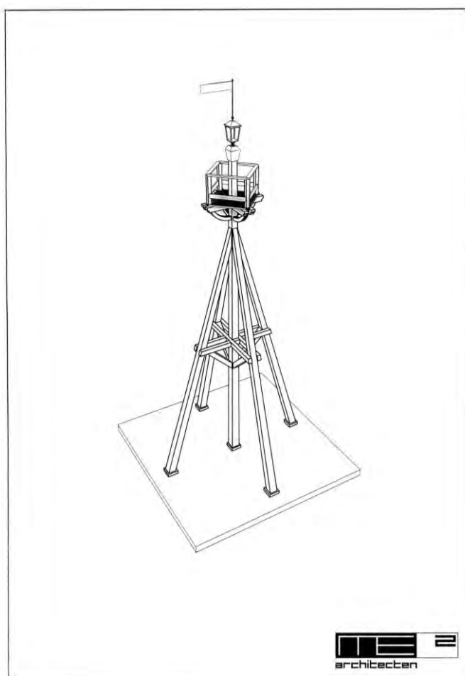
Afbeelding: ontwerptekening van het nieuwe havenlicht. Op de tekening heeft de lamp de vorm van een ouderwetse lantaarn. Dit is niet gerealiseerd. (Stichting Stadsherstel Medemblik)

Op 28 augustus 2005 werd een hoofdstuk aan de geschiedenis van het Medemblikker havenlicht toegevoegd. Op deze dag verrees op de kop van de Oosterhaven een nieuw havenlicht. Ditmaal lagen er geen klachten van schippers aan ten grondslag. Het idee was afkomstig van Stichting Stadsherstel Medemblik, die met het nieuwe lichtbaken het historische stadsgezicht wil versterken.