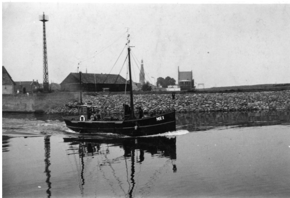
Afbeelding: de ME 1 verlaat de haven. De foto is rond 1954 genomen. Links van de boot is het ijzeren geleidelicht uit 1939 zichtbaar. Rechts van de ME 1 is het stadhuis en de gasfabriek te zien. De fabriek leverde lange tijd de brandstof voor het havenlicht.