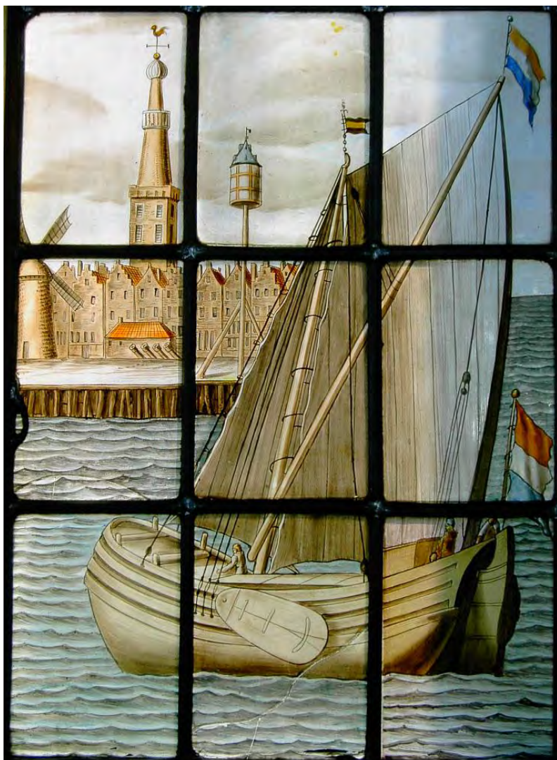
Afbeelding: detail van het glas van het rijnschippersgilde in de Bonifaciuskerk. Het glas werd in 1669 door het schippersgilde geschonken. De afbeelding toont een binnenschip dat de havenmond van Medemblik nadert. Links van de mast is het havenlicht zichtbaar. Bijna 30 jaar eerder was het licht op verzoek van de schippers zelf opgericht.

inkoop van kaarsen voor het havenlicht, een tweede betaling werd verricht aan de persoon die in 1642 toezicht op het licht had gehouden.