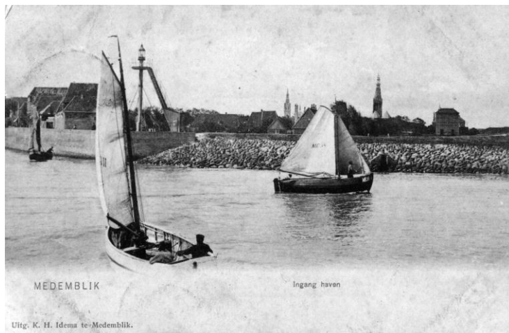
Afbeelding: het havenlicht omstreeks 1900. Sinds 1882 had het licht een plek aan het einde van de Oosterhaven gekregen. Een trap, om bij de lampen in de lantaarn te kunnen komen, maakte deel uit van de opstand. De toegang tot de trap kon met een deur worden afgesloten.